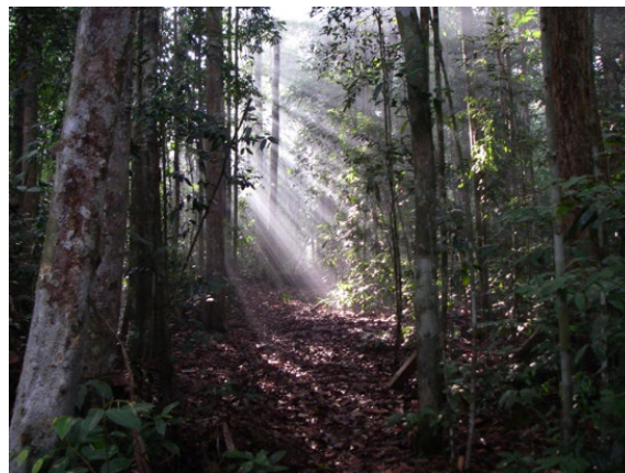
マレーシア・パソの熱帯多雨林