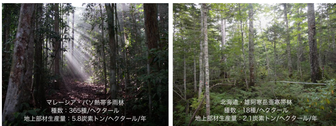
図 1：マレーシア・パソの熱帯多雨林（左）および北海道・雄阿寒岳の亜寒帯林（右）

本研究では、インドネシアやマレーシアの熱帯林から台湾や沖縄の亜熱帯林、そして鹿児島温暖帯林から北海道の亜寒帯林に至る 60 の森林の継続調査データを解析しました（図 1）。これには環境省モニタリングサイト 1000 の森林調査サイトも 40 箇所含まれます。これらの地域はモンスーン気候の影響により一年を通して森林が成立するのに十分な降水量があります。そのため、森林間の樹木種の多様性や生産量の違いは年平均気温によってよく予測することができ、年平均気温が高くなるほど多様性や生産量が高くなっています。